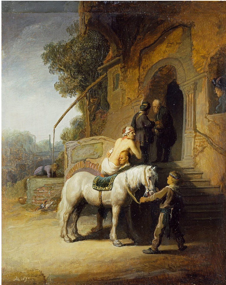
Rembrandt van Rijn: Milosrdný Samaritán

Mějme zájem jeden o druhého a povzbuzujme se k lásce a k dobrým skutkům.